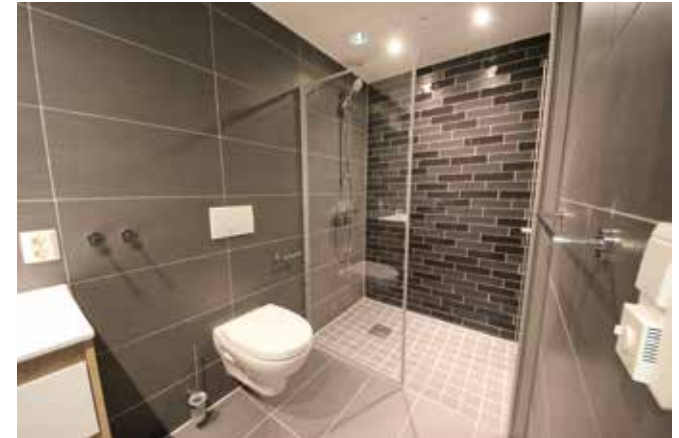
Probad leverer komplette løsninger med alt av tilbehør til badet.