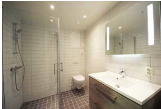
Små fungerende baderom gir optimal funksjonalitet og god økonomi.