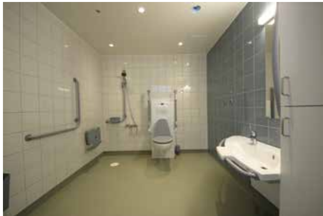
Vi besitter kompetanse rundt funksjonell innredning mot helsebygg.

Probadet kan også meget enkelt rehabiliteres. Da konstruksjonen er i stålfiberarmert betong, kan flisene fjernes, betongen pusses og nytt tettesjikt og fliser kan legges. Våre designere og tekniske tegnere innreder og designer baderom i tett samarbeid med kunden. Vi besitter også kompetanse mot funksjonelle baderom til helsebygg og kan bistå med gjennomtenkte løsninger som gir store besparelser ved effektiv arealutnyttelse.